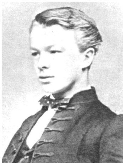
Jaroslav Goll (1846 -1929)