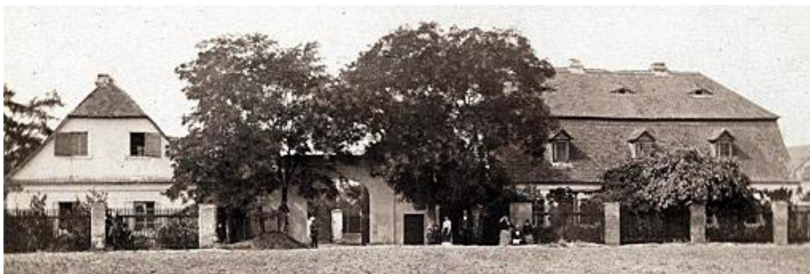
Lamberk na historické fotografii

V sobotu 17. května podnikli členové SBS celodenní autokarový zájezd. V Obříství navštívili znovuotevřený památník B. Smetany na usedlosti Lamberk (uzavřený po povodních r. 2002, kdy byl zaplaven do výše 1 m). V Obříství kdysi působili Smetanovi rodiče a na Lamberku žila také rodina Ferdinandiových, z níž pocházela druhá Smetanova choť (byli oddáni v místním kostele 10. července 1860). Smetana sem častěji přijížděl a začal zde také komponovat Prodanou nevěstu. Další zastávkou byla zřícenina hradu Kamýk a návštěva Smetanovy světničky. Následovaly Litoměřice (procházka náměstím, zastávka u katedrály sv. Štěpána a u domu, kde žil K. H. Mácha). Poslední zastávkou byly Ploskovice (prohlídka zámku a zámecké zahrady).