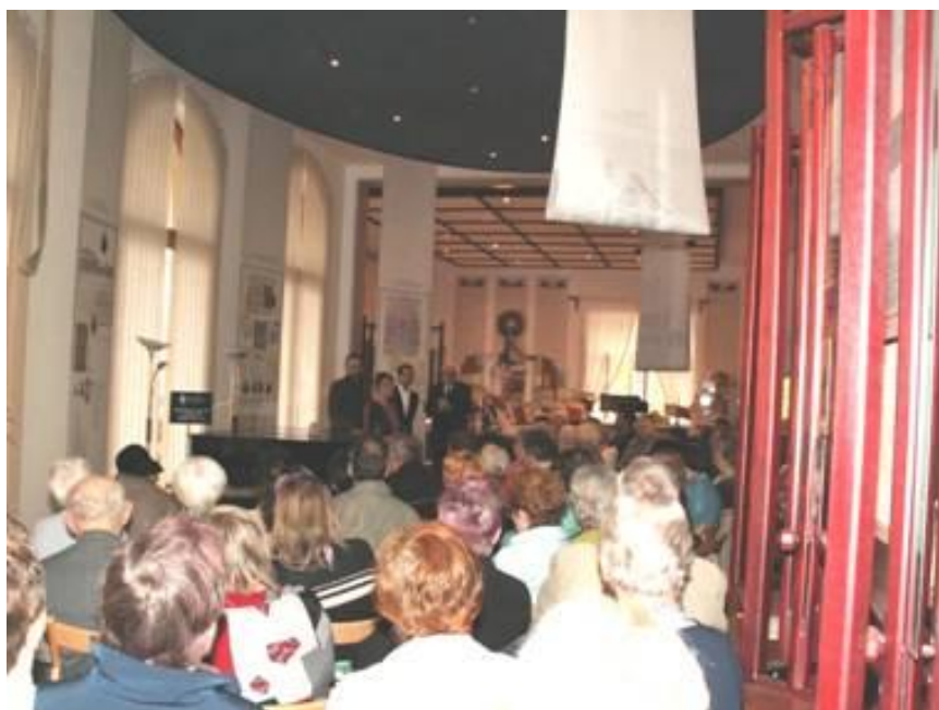
O tento pořad byl velký zájem

Z předchozích sezón zůstává na repertoáru Libuše a Tajemství , v této sezóně byla nově nastudována Hubička , už na začátku nové sezóny bude uvedena Prodaná nevěsta (předpremiéra v červnu na festivalu Smetanova Litomyšl).