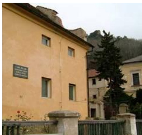
Dům pod zříceninou tvrze Kamýk, v němž po svatbě v létě 1860 pobýval B. Smetana