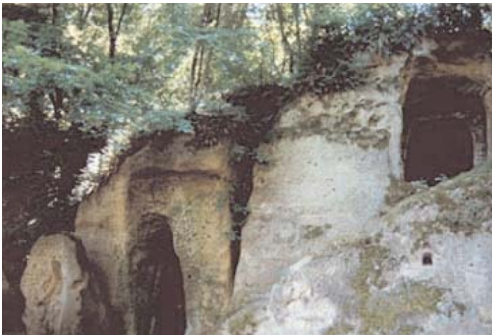
Pozůstatky středověkého skalního hradu Staráky u Kokořína

V letošním roce uplyne již 170 let od smrti Karla Hynka Máchy (6. 11.). Život a dílo tohoto knížete českých básníků si můžeme vhodně připomenout i vycházkou po méně známých místech Kokořínska, úzce spjatých s jeho tvorbou. Mácha si tento kraj nesmírně oblíbil, což dokládají nejen kresby hradu, ale i četné zmínky v jeho zápisnicích. V Dílu prvním plánu cesty do Krkonošů z Prahy z roku 1833 (v tomto jakémsi Máchově itineráři) se mimo jiné dočteme: „ Odtud [půjdeme] na Vysokou přes nový Kokořín do zřícenin starého Kokořína, v jehožto sklepích nám bude přenocovati. Zde nocleh i večere. “ Tento úryvek dokládá, že básník trasu Praha – Mělník – Kokořín výborně znal a prošel ji zřejmě i několikrát. Zmínka o „ novém Kokořínu “ se týká vesnice nad Kokořínským dolem se zámečkem postaveným v 18. století ro-