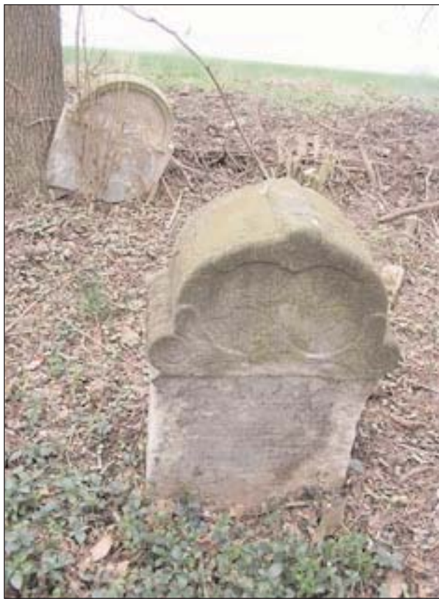
Starý židovský hřbitov nedaleko Bosyně, okterém se píše v Máchových Cikánech

Do vesnice Kokořín (asi 1 km od hradu nad Kokořínským údolím) vede modrá turistická značka, až ke Starákům však nepokračuje – najdeme je však poměrně snadno. Zámek obejdeme a na východní straně, v místech, kde přiléhají hospodářské budovy, zabočíme do zarostlého parku. Stavení necháme za zády, po vyšlapané cestičce zamíříme na okraj strže a odtud opatrně sestoupíme dolů ke skalním místnos-