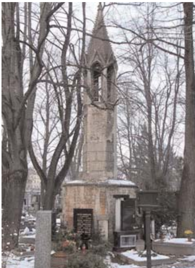
Stará zvonice („minaret“) na někdejším trestaneckém hřbitově