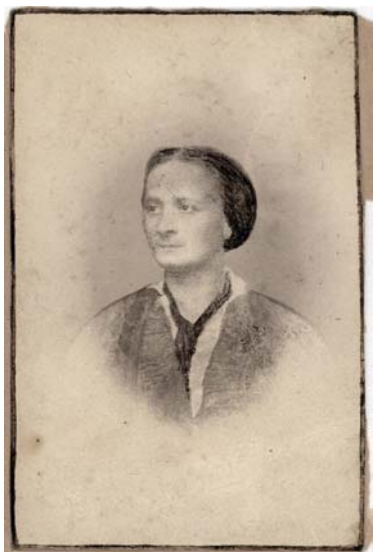
Daguerrotypie Boženy Němcové, pochází asi z let 1855 - 1856